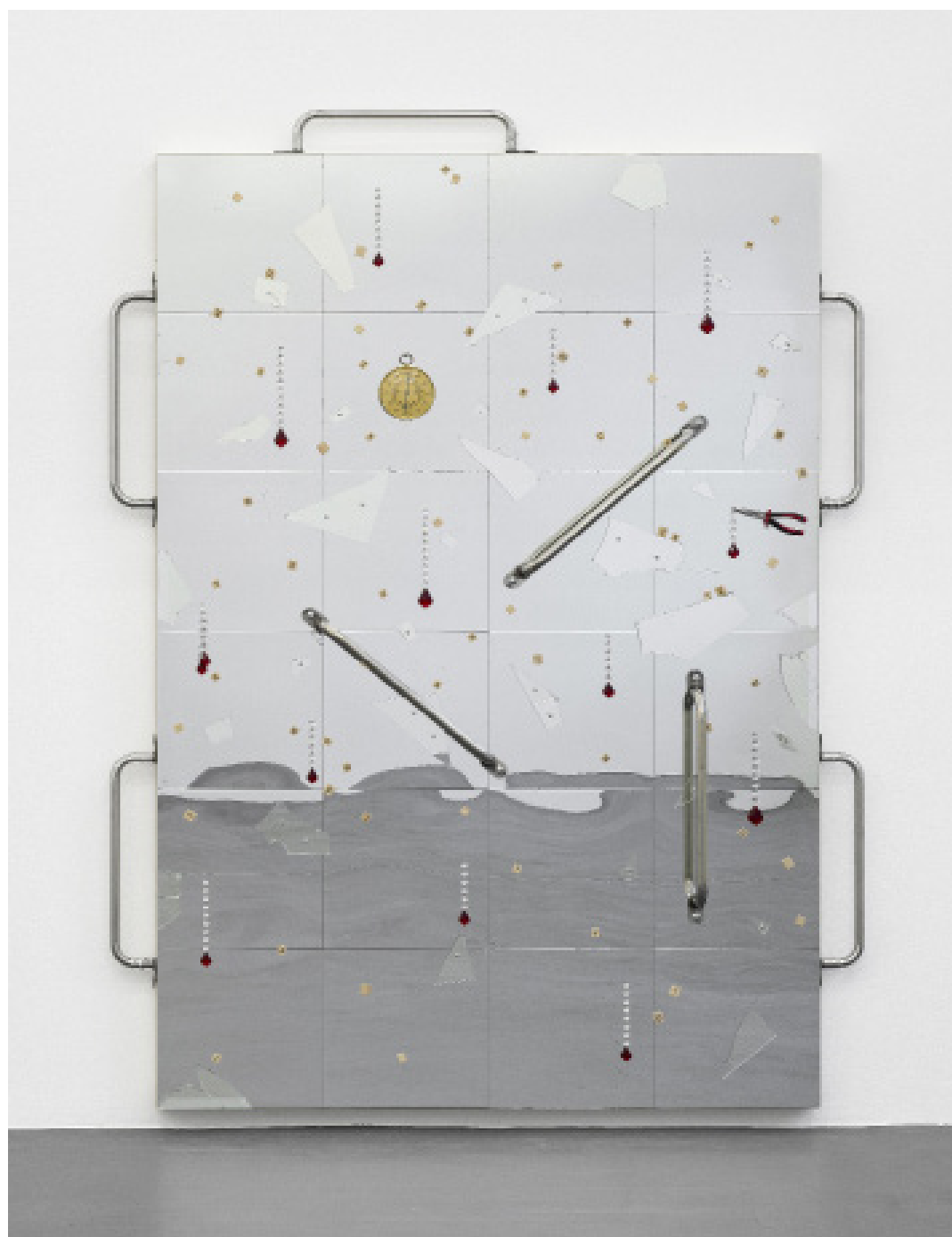
Sarah Benslimane, Les mains en l'air (détail), 2025 techniques mixtes, 240 × 160 × 18 cm