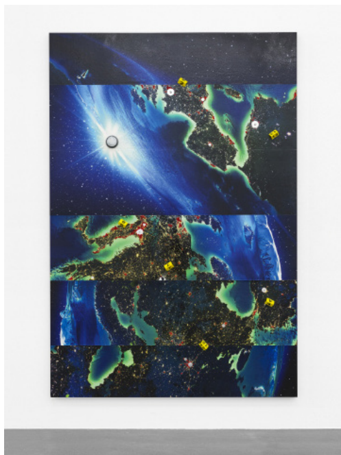
Sarah Benslimane Le monde à l'envers , 2025 techniques mixtes, 280 × 190 × 10 cm