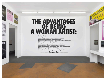
Guerrilla Girls (fondé en 1985) Guerrilla Girls' Portfolio Compleat: 1985-2012 with Upgrade 2012-2016, 1985-2016, 1985-2016 Ensemble de quatre vidéos, 110 affiches et stickers, cinq livres, deux bulletins d'information, tirages offset et tirages numériques sur papier anti-acide et papier photographique. Dimensions variables pour chaque élément éd. 50/50 Coll. MAMCO