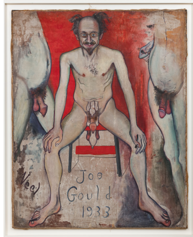
Alice Neel (1900-1984) Joe Gould, 1933 Huile sur toile, 99,1 × 79,1 cm