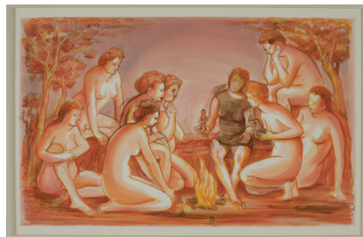
Nicole Eisenman (1965–) Golum, 2004 Aquarelle et crayon sur papier, 70.7 × 109 cm