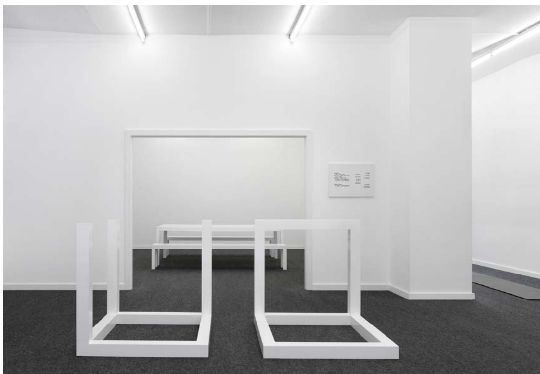
Vue partielle de L'Appartement