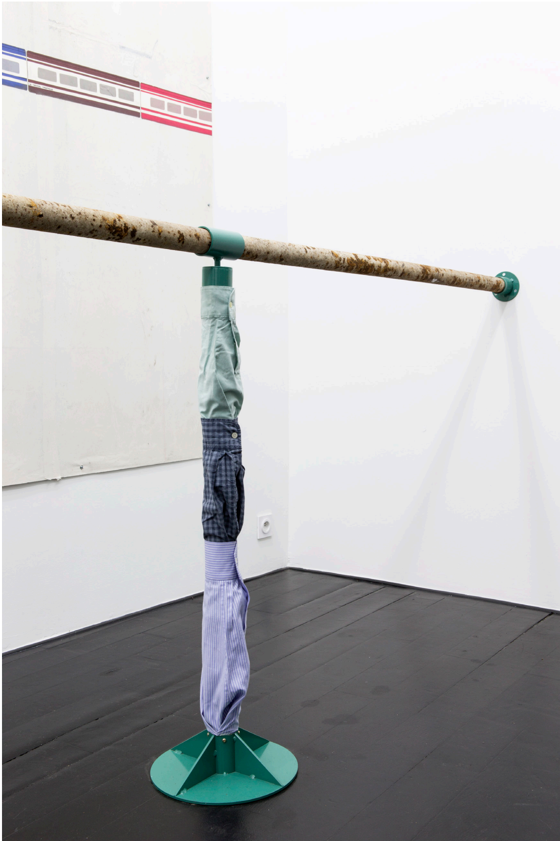
Timothée Calame, 27 générations de services culturels , 2016 (détail) Tuyaux de chauffe, acier peint, hêtre, coton, dimensions variables